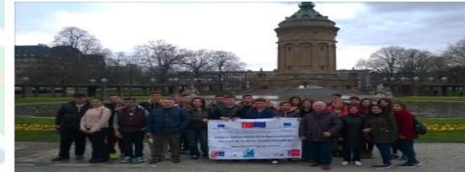
METEM öğrencileri Almanya'da

Tarih: 30.3.2016 07:21:14 / 6310okunma / Oyonum