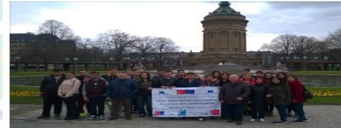
METEM öğrencileri Almanya'da

Tarih: 30.3.2016 07:21:14 / 6310okunma / Oyonum