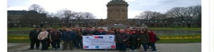
Mesleki Eğitim Merkezi öğrencileri Almanya'da

Erasmus+ Mesleki Eğitim Öğrenci Ve Personel Hareketliliği Projeleri Kapsamında Almanya'nın Ludwigshafen şehrinde staja başladılar.